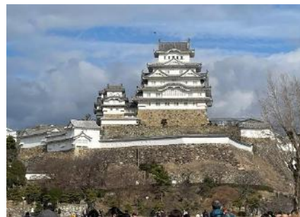
新春の姫路城(令和5年1月2日撮影) 姫路神社は天守閣の北東に鎮座します。